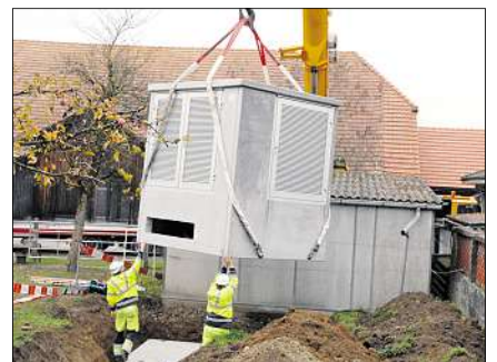
Die Häuser der neuen Überbauung Aspi in Moosseedorf benötigen Strom. Damit die Kapazität auch bei Spannungsspitzen gewährleistet ist, wurde auf der Schössliwegmatte eine Trafostation installiert. sin.