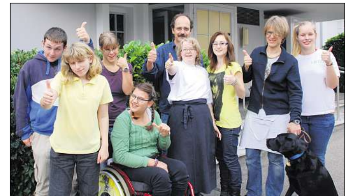
Das Bistro-Team inklusive Blindenführhund Sokrates.

Die ersten Gäste treffen ein, die Spannung steigt. Heute sind es 30 Personen aus dem Umkreis der Stiftung, aber auch von