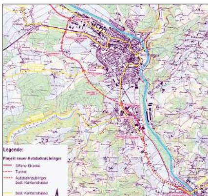
Die geplante Linienführung der Umfahrung.

Um Burgdorf, Oberburg und Hasle vom Verkehrschaos zu befreien sei die Westumfahrung unumgänglich, erklären Verkehrsexperten.