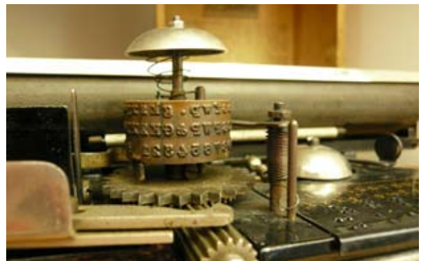
Objekt aus dem Blindenmuseum: Blindenschreibmaschine Picht