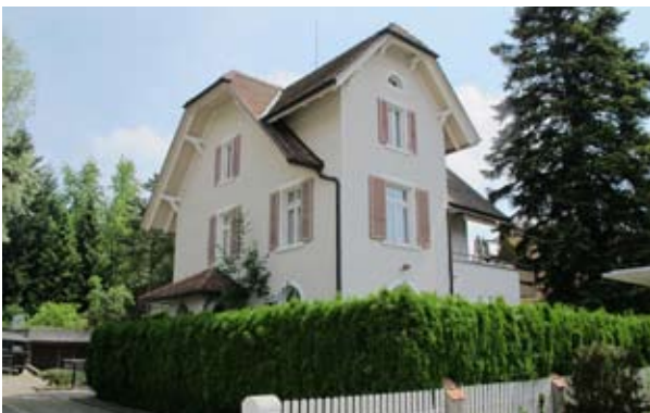
Wohngruppenhaus für Erwachsene

Beim Aufbau unseres Qualitätsmanagementsystems haben wir uns für ein Vorgehen in kleinen Schritten aus eigenen Ressourcen entschieden. Die Elemente der Strukturqualität nach kantonaler Vorgabe bestehen seit längerer Zeit und werden laufend aktuell gehalten. Im 2010 haben wir die Prozessarchitektur erstellt, erste wichtige Prozesse vollständig dokumentiert und mit den geltenden Grundlagen verknüpft. Eine Zertifizierung wird vorerst nicht angestrebt, doch wir achten darauf, dass dieser Weg jederzeit möglich bleibt.