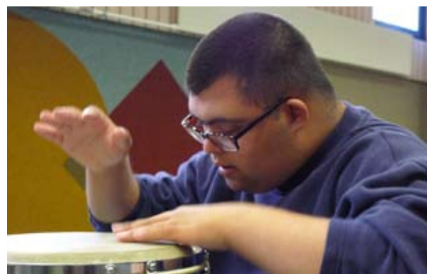
Eindrückliche Bilder aus der Musiktherapie

Ein tolles, neues Angebot für die Schülerinnen und Schüler MFB ist die Musiktherapie , welche für die Schuljahre 2009/2010 und 10/11 von der Stiftung Cerebral gespendet wurde. Zudem durften wir im Herbst eine wunderschöne Klangwiege in Empfang nehmen, die seither fast täglich im Einsatz steht.