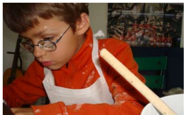
Vielseitiges Angebot in der Projektwoche