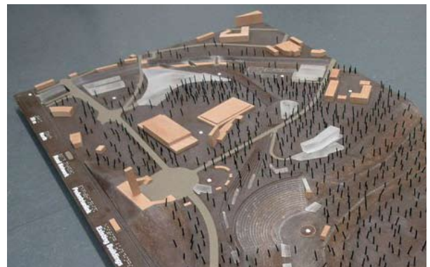
Taktiler und akustischer Modell des Gewinnerprojekts «link it»