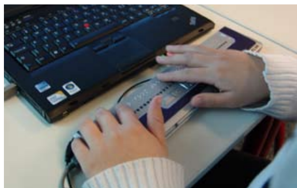
Ambulanter Dienst: Braillezeile und Laptop