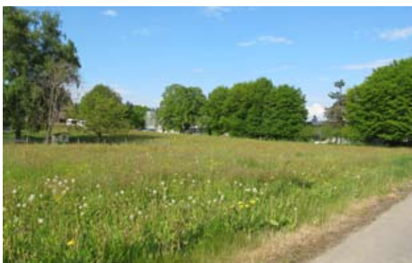
Das Gelände der «Schäferei»

Ein äusserst erfreulicher Anlass fand am 4. November 2010 in Form des Mitarbeitertages statt. Die Besuche zahlreicher Mitglieder des Stiftungsrats auf den verschiedenen Abteilungen unserer Institution ermöglichten spannende und informative Einblicke und erlaubten tief beeindruckende Begegnungen. Die konkreten Einblicke führten beispielsweise vor Augen, welche schwierige Voraussetzungen trotz des erfolgreichen Umbaus beim Raumangebot bestehen und welcher Veränderungsbedarf nach wie vor gegeben ist. Die Mitglieder des Stiftungsrats