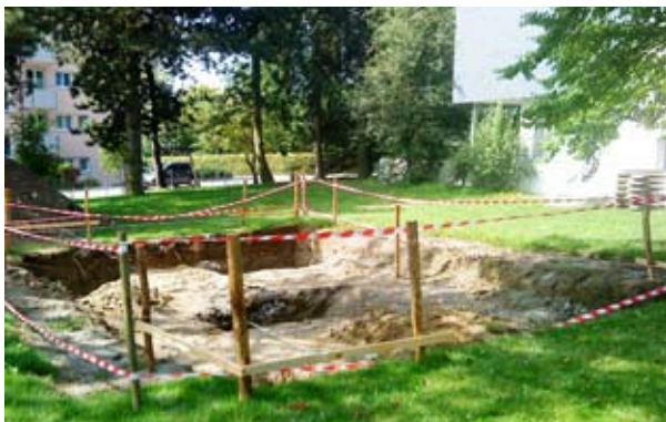
Der erste Aushub für das Fundament der Schaukel

Die Mitarbeiter unseres Technischen Dienstes erstellen ein Fundament für die Montage der Rollstuhlschaukel. Der Kauf der Schaukel wurde durch Spenden ermöglicht.