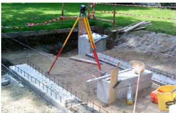
Das Fundament nimmt langsam Formen an